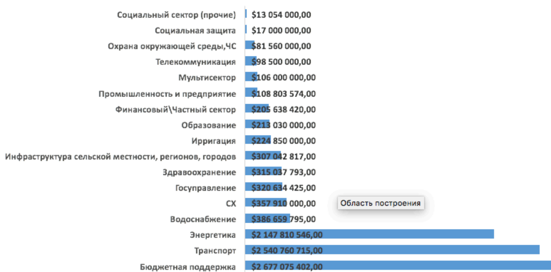
Финансовая помощь Кыргызской Республике по секторам по состоянию на 01.06.2019г. (доллар США)

Куда были направлены финансовая помощь можете увидеть на графике ниже: